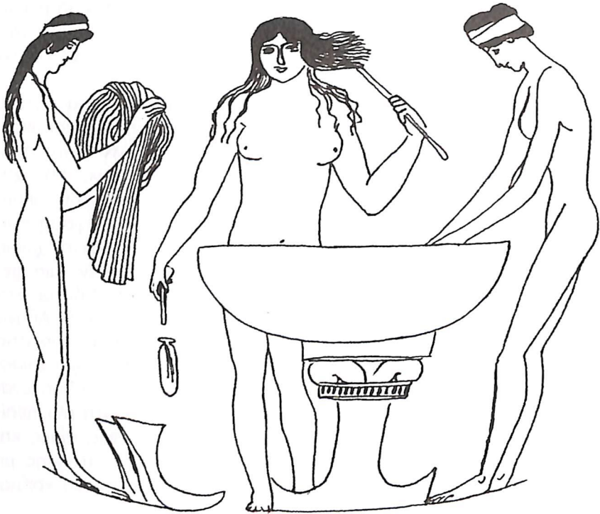
Εικόνα 5 Στάμνος Μονάχου AS 2411

θληση. Αν και η πλειοψηφία των μελετητών δέχεται τον ηδονοβλεπτικό χαρακτήρα των σκηνών αυτών, που είναι ηπιότερος από τις προγενέστερες, πορνογραφικού τύπου σκηνές 59 , εντούτοις έχει διατυπωθεί πειστικά η άποψη ότι παρουσιάζουν μια συγκεκριμένη τελετουργία της προετοιμασίας του γάμου, το προγαμιαίο λουτρό 60 .