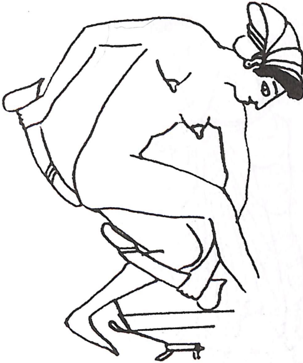
Εικόνα 3 Κύλिका της Αγίας Πετρούπολης, Ερμιτάζ 14611

κή βία 48 , ή που απεικονίζονται ως γερασμένες, με πλαδαρά σώματα και άσχημα πρόσωπα να συναναστρέφονται νέους άνδρες 49 .