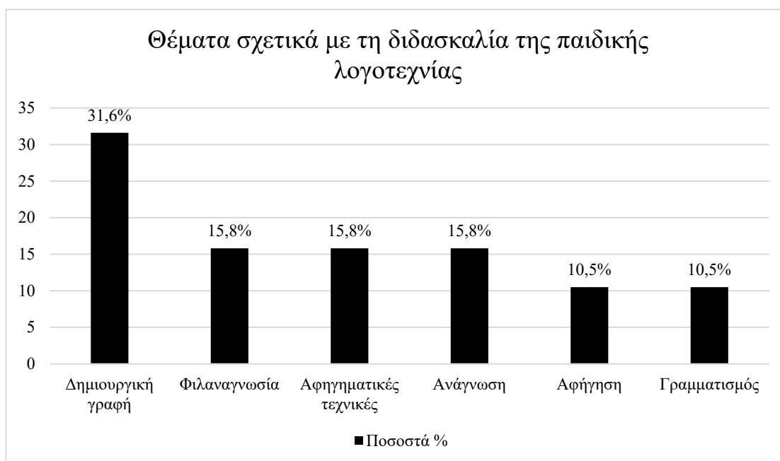
Γράφημα 4: Ραβδόγραμμα με τα ποσοστά των διδακτορικών διατριβών ως προς τα θέματα που σχετίζονται τη διδασκαλία της παιδικής λογοτεχνίας