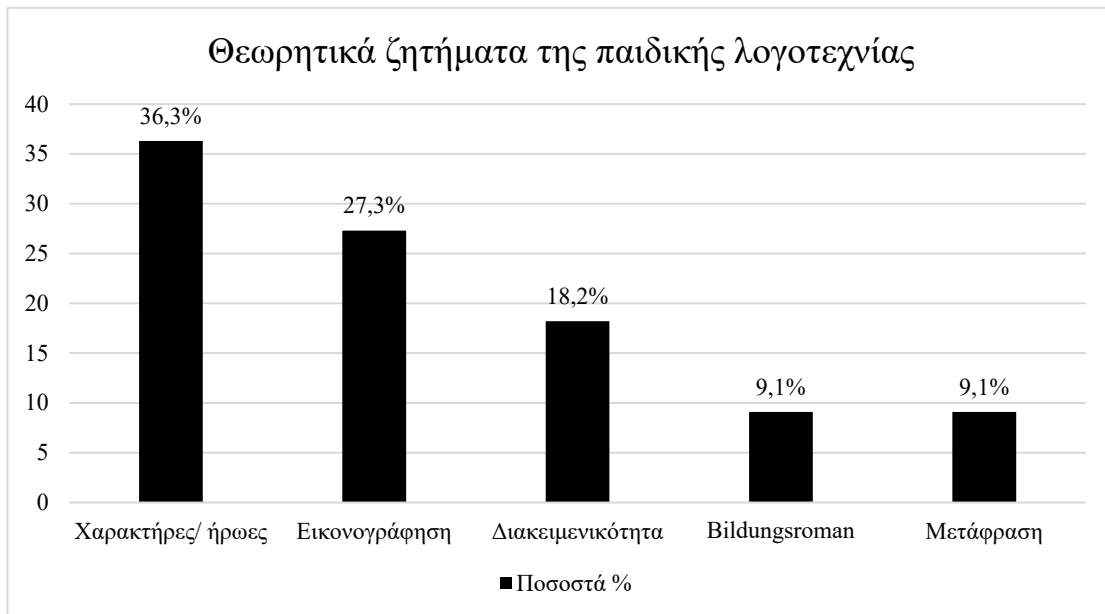
Γράφημα 3: Ραβδόγραμμα με τα ποσοστά των διδακτορικών ως προς τα θεωρητικά ζητήματα της παιδικής λογοτεχνίας που μελετούν