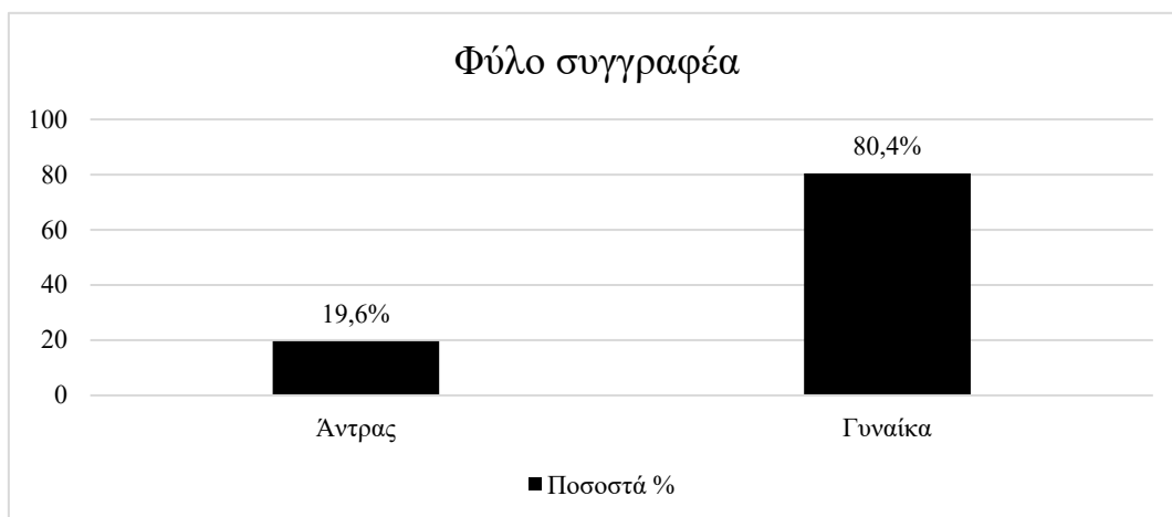
Γράφημα 1: Ραβδόγραμμα με τα ποσοστά των διδακτορικών διατριβών ως προς το φύλο του συγγραφέα

Αναφορικά με το φύλο των συγγραφέων των διδακτορικών διατριβών, παρατηρείται ότι 32 από τους 163 διδακτορικούς τίτλους, δηλαδή το 19,6%, ανήκουν σε άντρα συγγραφέα και 131 από τους 163 διδακτορικούς τίτλους, δηλαδή το 80,4%, σε γυναίκα συγγραφέα (Γράφημα 1).