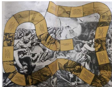
Εικόνα 2: Παιχνίδι 26 ου τεύχους, Μάρτιος 1980

Στο 26 ο τεύχος (Μάρτιος 1980) της πρώτης περιόδου, «το ρόδι» δημοσιεύει στις σελίδες του ένα επιτραπέζιο παιχνίδι με τίτλο "Η μάχη στα Δερβενάκια". Το συγκεκριμένο παιχνίδι παίζεται με ένα ζάρι και πιόνια. Έχει μία διαδρομή με τετράγωνα την οποία καλούνται να ακολουθήσουν όλοι οι παίκτες. Ακολουθώντας αυτή τη διαδρομή οι παίκτες παρακολουθούν την εξέλιξη της μάχης στα στενά των Δερβενακίων έτσι όπως την έζησαν οι Έλληνες του 1821. Ανάλογα με τον αριθμό που φέρνουν, όταν ρίχνουν το ζάρι, προχωρούν και τα αντίστοιχα τετράγωνα στην διαδρομή του παιχνιδιού. Κάποια από τα τετράγωνα αναγράφουν εντολές. Όταν κάποιος παίκτης βρεθεί πάνω σε ένα από αυτά τα τετράγωνα καλείται να ακολουθήσει την εντολή που αναγράφει και να πράξει ανάλογα. Αυτές οι εντολές στόχο έχουν άλλοτε να καθυστερήσουν και άλλοτε να βοηθήσουν τον εκάστοτε παίκτη να προχωρήσει και να φτάσει στη νίκη.