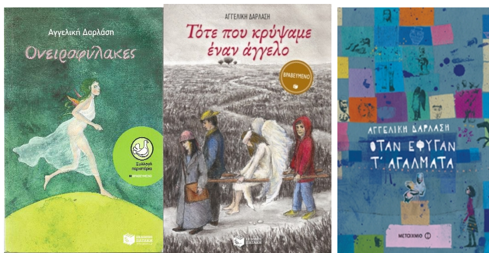
Εικόνα 1. Τα εξώφυλλα των βιβλίων της Αγγελικής Δαρλάση

στ) Αλάστρα του Γιώργου Παναγιωτάκη από τις εκδόσεις Πατάκη (2015).