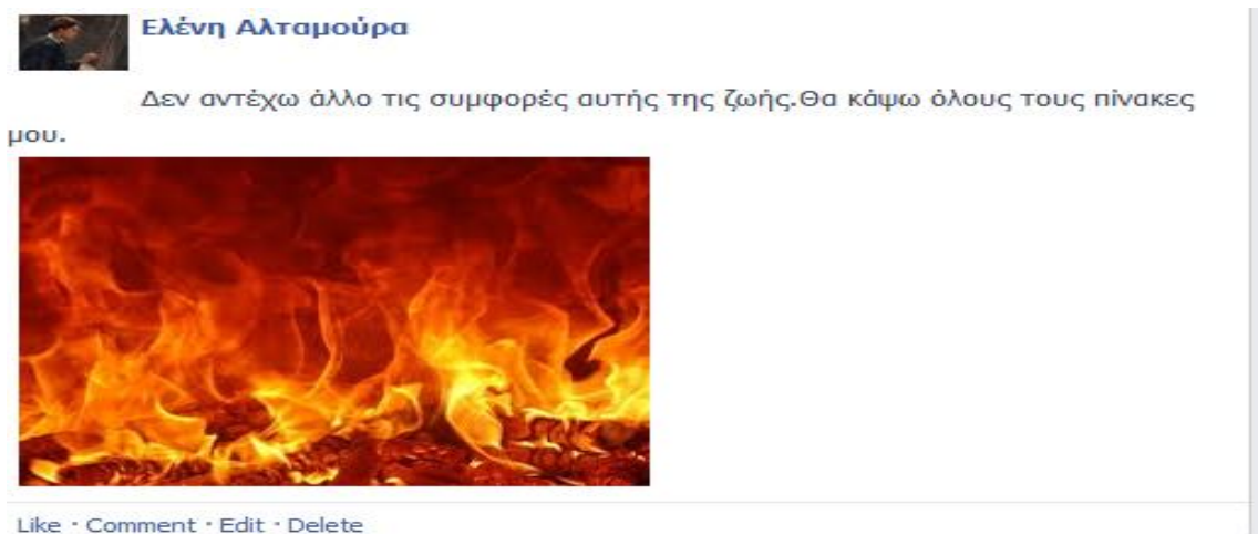
Εικόνα 2: Δημιουργία εικονικού προφίλ στο fakebook