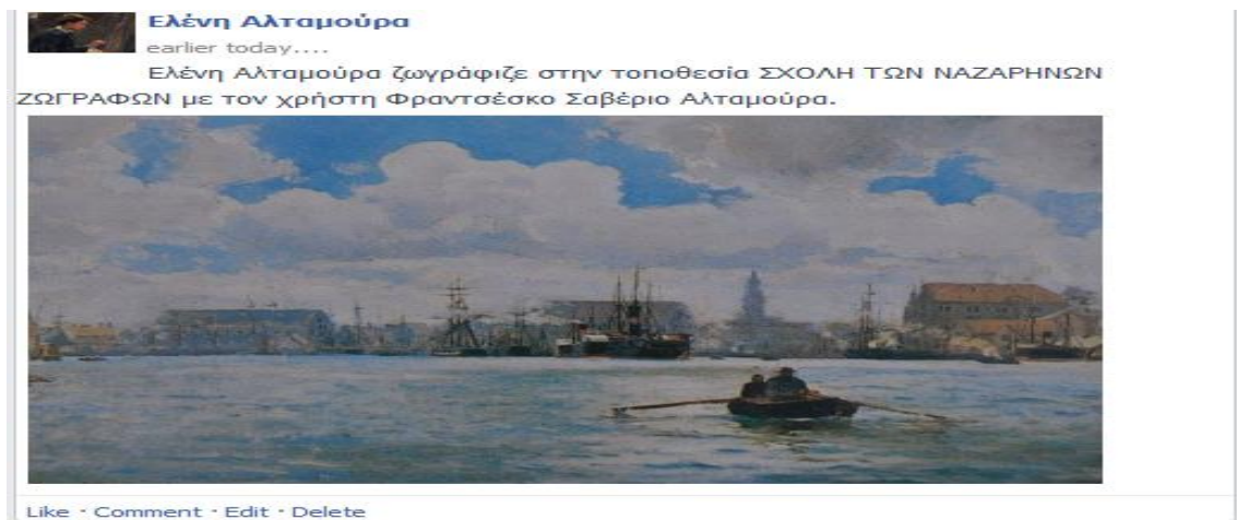
Εικόνα 3: Δημιουργία εικονικού προφίλ στο fakebook