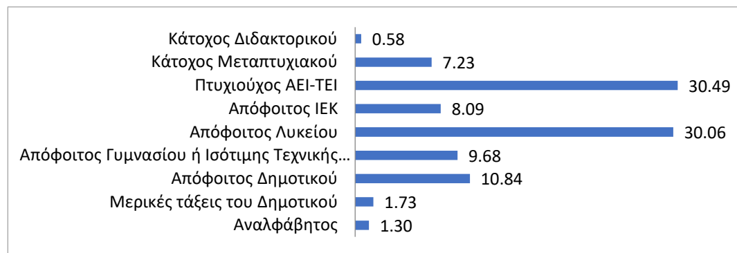
Σχήμα 1. Ποσοστιαία κατανομή εκπαίδευσης ερωτηθέντων

Από τον Πίνακα 3 προκύπτει ότι όσοι δεν έχουν αποφοιτήσει από το δημοτικό είναι ηλικίας αποκλειστικά άνω των 50 ετών, ενώ από τους απόφοιτους δημοτικού ελάχιστοι είναι κάτω των 40 ετών.