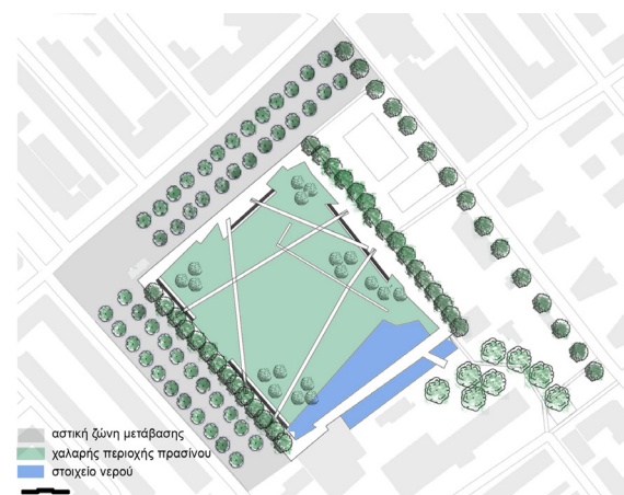
Σχήμα 5. Κεντρική ιδέα: χαλαρή περιοχή πρασίνου που περιβάλλεται από αστικές ζώνες μετάβασης