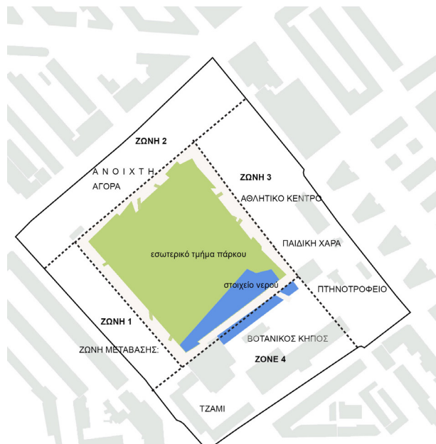
Σχήμα 4. Ανάπτυξη του Πάρκου σε ζώνες με διαφορετικές λειτουργίες