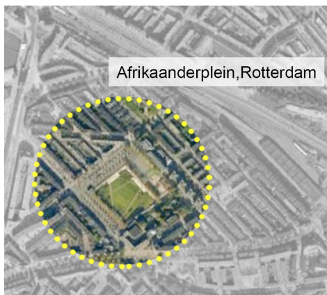
Σχήμα 3. Τοποθεσία Πάρκου

ανάγκες των χρηστών και να ενθαρρύνει τις αλληλεπιδράσεις και το διάλογο μεταξύ τους. Το κλειδί για το σχεδιασμό που οδήγησε σε ένα επιτυχημένο και γεμάτο ζωή πάρκο ήταν οι συμμετοχικές δραστηριότητες της κοινότητας που οργάνωσε η αρχιτεκτονική ομάδα, τα αποτελέσματα των οποίων καθοδήγησαν το σχεδιασμό (OKRA Landschapsarchitecten, 2017).