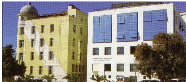
Εικόνα 1. Το κτίριο Παπασοράτου και Δελμούζου (Βόλος)