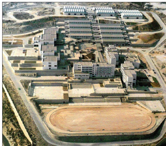
Εικόνα 3. Αεροφωτογραφία του ΤΕΙ Καβάλας

Η δυσκολία πρόσβασης (σχεδόν αθέατο από το δρόμο) σε συνδυασμό με την αυστηρή οριοθέτησή του με ψηλό τοίχο αντιστήριξης –που οπτικά λειτουργεί σαν αμυντικό τείχος– λειτούργησε εκ των πραγμάτων προβληματικά, ιδιαίτερα γιατί στέρησε από την ακαδημαϊκή κοινότητα τη συνέχεια και την πολυπλοκότητα της αστικής ζωής. Η πρόσβαση γίνεται με αστική συγκοινωνία και ΙΧ και είναι αποκομμένο από την περιβάλλουσα οικιστική ενότητα. Η εξυπηρέτηση από το δίκτυο αστικής συγκοινωνίας δεν είναι επαρκής (μικρή συχνότητα δρομολογίων), ενώ δεν υπάρχουν δίκτυα εναλλακτικών μετακινήσεων (ποδηλατόδρομοι, πεζόδρομοι). Η προσβασιμότητα του ΤΕΙ Καβάλας αναμένεται να αυξηθεί με την κατασκευή και λειτουργία της περιμετρικής οδού της πόλης, και ιδιαίτερα του δυτικού της τμήματος όπου προβλέπεται και δημιουργία δεύτερου κόμβου πρόσβασης, ενώ στο υπό εκπόνηση Γενικό Πολεοδομικό Σχέδιο της Καβάλας (2010), το ζήτημα της έλλειψης χώρου προβλέπεται να λυθεί με επέκταση του campus του ΤΕΙ Καβάλας στην περιοχή αυτή (Σχήμα 2). Η σύνδεση, πάντως, του ΤΕΙ με την υπόλοιπη πόλη και ιδιαίτερα με το κέντρο της, παρουσιάζεται σήμερα δύσκολη και δεν αναμένεται να βελτιωθεί σημαντικά στο προσεχές, τουλάχιστον, μέλλον. Ο βαθμός απομόνωσης του ΤΕΙ από την υπόλοιπη πόλη, περαιτέρω επιτείνεται και από το γεγονός λειτουργίας μέσα στις εγκαταστάσεις του και τριών κτιρίων διαμονής σπουδαστών/φοιτητικές εστίες (για 450 σπουδαστές, από το σύνολο των 10.000 εγγεγραμμένων). Έτσι, λόγω και των δυσκολιών