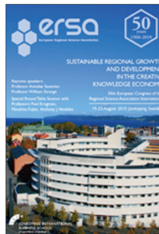
50 ο Συνέδριο, Jönköping, Σουηδία

Θέμα του συνεδρίου ήταν η ανάπτυξη των πόλεων και περιφερειών της Ευρώπης στο σύγχρονο κόσμο ( New Challenges for European Regions and Urban Areas in a Globalised World ) και διήρκεσε επίσης πέντε ημέρες, 30 Αυγούστου έως 3 Σεπτεμβρίου.