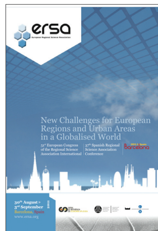
51 ο Συνέδριο, Βαρκελώνη, Ισπανία