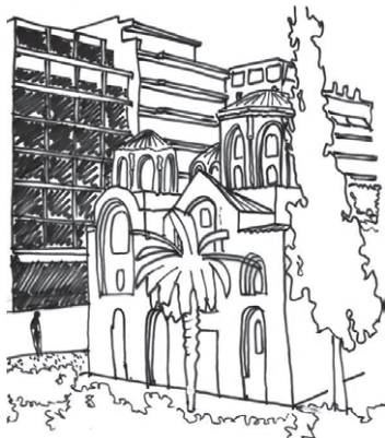
Εικόνα 3. Ανάκτορο Βαλεριού στην πλατεία Ναυαρίνου στη Θεσσαλονίκη

Η ύπαρξη σημαντικών ιστορικών μνημείων στον αστικό ιστό, σφραγίζει την εικόνα της πόλης.