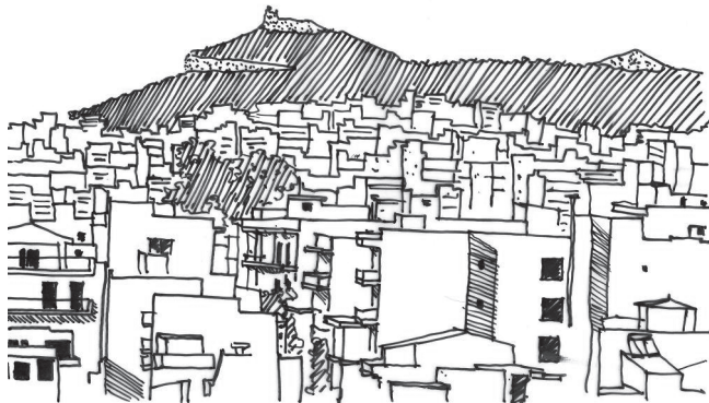
Εικόνα 2. Καβάλα

Τα ενδιαφέροντα φυσικά στοιχεία των ελληνικών πόλεων και οικισμών συμβάλουν θετικά στην πολεοδομική και αισθητική ποιότητα του οικιστικού περιβάλλοντος. Η πόλη προσφέρει φυγές, τόσο προς το βουνό, όσο και προς το παράκτιο μέτωπο.