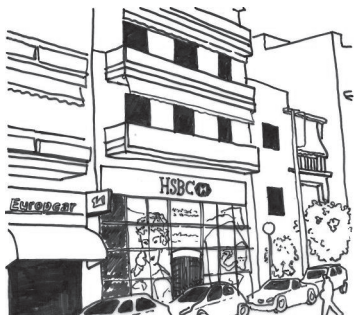
Εικόνα 5. Αθήνα/Ν. Σμύρνη

Το διαφοροποιημένο "international style" των ισογείων έναντι των ορόφων, σε συνδυασμό με ατέλειωτες σειρές από σταθμευμένα οχήματα που "ζώνουν" τα οικοδομικά τετράγωνα.