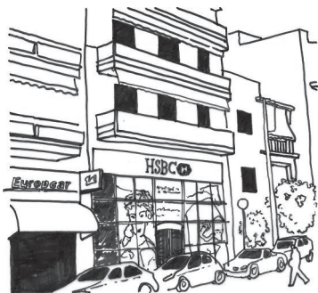
Εικόνα 4. Τυπική μορφή του δρόμου στην ελληνική πόλη

Έτσι, ο ήδη στενός δημόσιος χώρος επιβαρύνθηκε περαιτέρω, λόγω της κυκλοφορίας και στάθμευσης των οχημάτων, επιτείνοντας έτσι, ακόμη περισσότερο και το αίσθημα της στενότητας στην πόλη. Ο δρόμος, που στην ουσία αποτελεί τη μεγαλύτερη επιφάνεια δημόσιου χώρου στις ελληνικές πόλεις, καταλαμβάνεται από σταθμευμένα οχήματα, πολλές φορές σε ποσοστό άνω του 50% της ωφέλιμης επιφάνειάς του. Ακόμα και η απλή κίνηση των πεζών παρεμποδίζεται πλέον ασφυκτικά από τη στάθμευση, ενώ την ίδια στιγμή, η μορφή του δρόμου στην ελληνική πόλη έχει πλέον συνδεθεί με την γνωστή εικόνα των ατέλειωτων σειρών από σταθμευμένα οχήματα