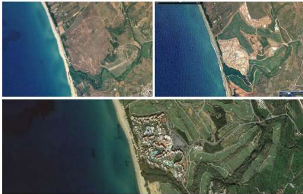
Εικόνα 7. Σταδιακή αποτύπωση της περιοχής μελέτης για τα έτη 2003,2009 και 2013.

Συμπερασματικά, το Costa Navarino είναι ένα ξενοδοχειακό συγκρότημα μεγάλης κλίμακας και ένας τουριστικός προορισμός υψηλών προδιαγραφών, ο οποίος έχει σχεδιαστεί και οργανωθεί σε αρμονία με το τοπίο. Παρόλα αυτά, πρόκειται για μία ανθρωπογενή παρέμβαση στο έως τότε παρθένο τοπίο όπως παρατηρείται στην Εικόνα 7, η οποία δεν είναι προσβάσιμη στο ευρύ κοινό. Ο νέος διαμορφωμένος χώρος προωθεί τις αρχές της βιωσιμότητας, της υψηλής αισθητικής και ποιότητας του τοπίου αλλά δημιουργήθηκε για να ικανοποιήσει τις υψηλές απαιτήσεις των επισκεπτών του και δεν χαίρει ευρείας απόλαυσης.