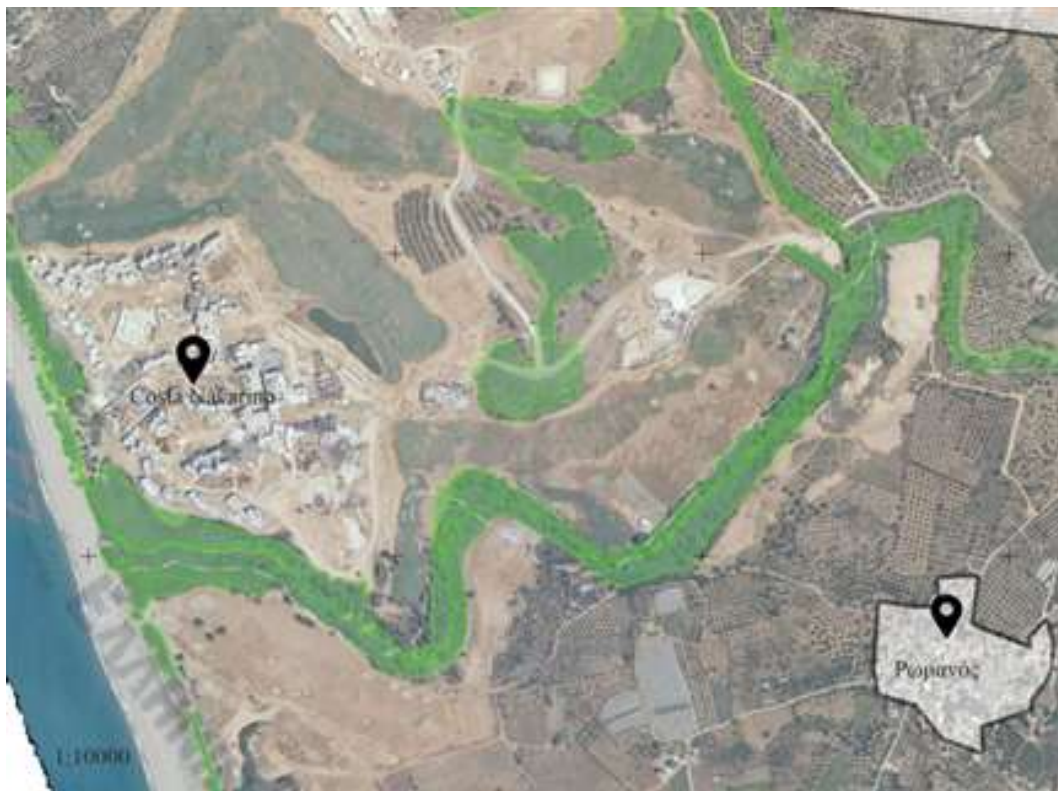
Εικόνα 5. Έκταση Costa Navarino σε σύγκριση με το χωριό Ρωμανός.

Με το εργαλείο χωρικού σχεδιασμού της ΠΟΤΑ και την απόφαση εφαρμογής της στη νοτιοδυτική Μεσσηνία δεν οριοθετείται απλώς η περιοχή και τα τμήματά της, αλλά κυρίως χωροθετούνται για πρώτη φορά στις εκτός σχεδίου πόλεως περιοχές με συγκεκριμένες χρήσεις γης, ο συνδυασμός των οποίων αντιπροσωπεύει το περιεχόμενο της ΠΟΤΑ Μεσσηνίας. Ως αποτέλεσμα, ο αγροτικός χαρακτήρας της περιοχής μετατρέπεται αναγκαστικά σε τουριστικό με επιπτώσεις επιπέδου περιφερειακής ενότητας (Δικαίος, 2010).