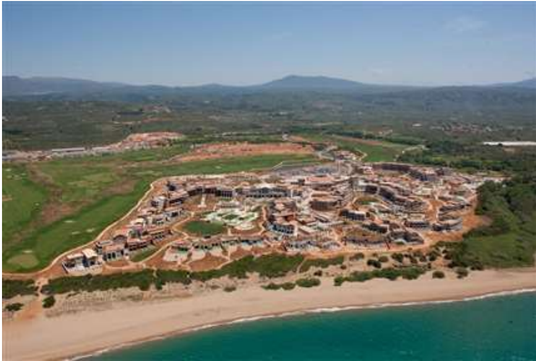
Εικόνα 6. Αεροφωτογραφία Costa Navarino.