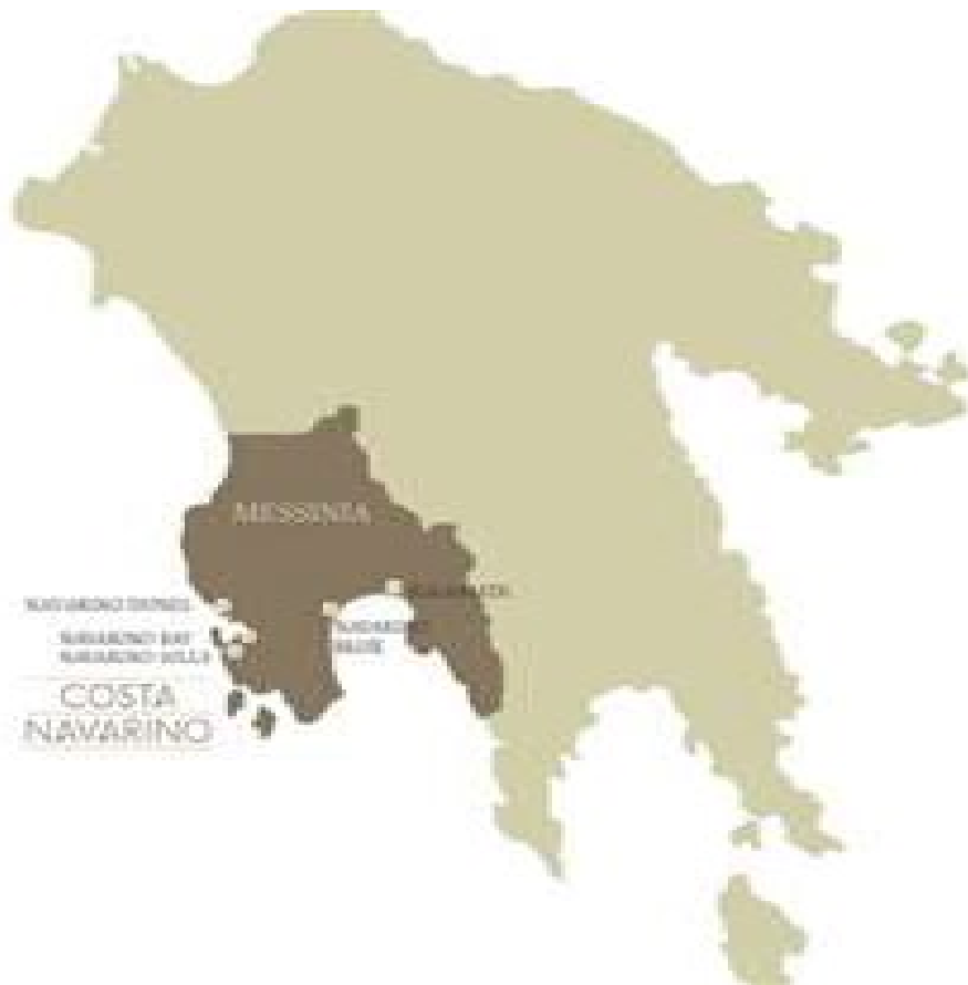
Εικόνα 4. Χάρτης εντοπισμού των ξενοδοχειακών συγκροτημάτων του Costa Navarino

Σε λειτουργία βρίσκεται ήδη το Navarino Dunes 5 που αναπτύσσεται κατά μήκος ενός χιλιομέτρου ακτογραμμής σε έκταση 1340 στρεμμάτων και βρίσκεται σε απόσταση περίπου 10 χλμ από την Πύλο. Το τμήμα ΠΟΤΑ Ρωμανός (Navarino Dunes) περιλαμβάνει: